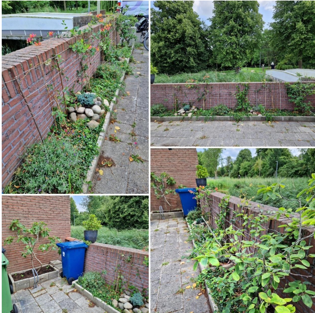
Afb. 2 Collage Bakkerstraat winnaar 2 e prijs geveltuinenwedstrijd