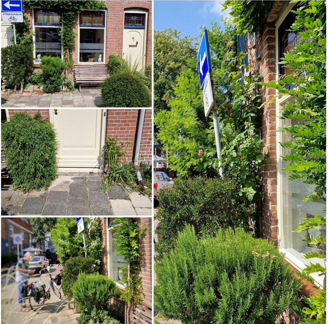
Afb. 3 Collage Stuartstraat winnaar 3 e prijs geveltuinenwedstrijd

De meerwaarde van deze bijeenkomst is de steun in de rug voor de geveltuiniers; ze ervaren zo dat ze het niet alleen doen. Dat geeft de burger moed en er is ruimte voor uitwisseling en vragen.