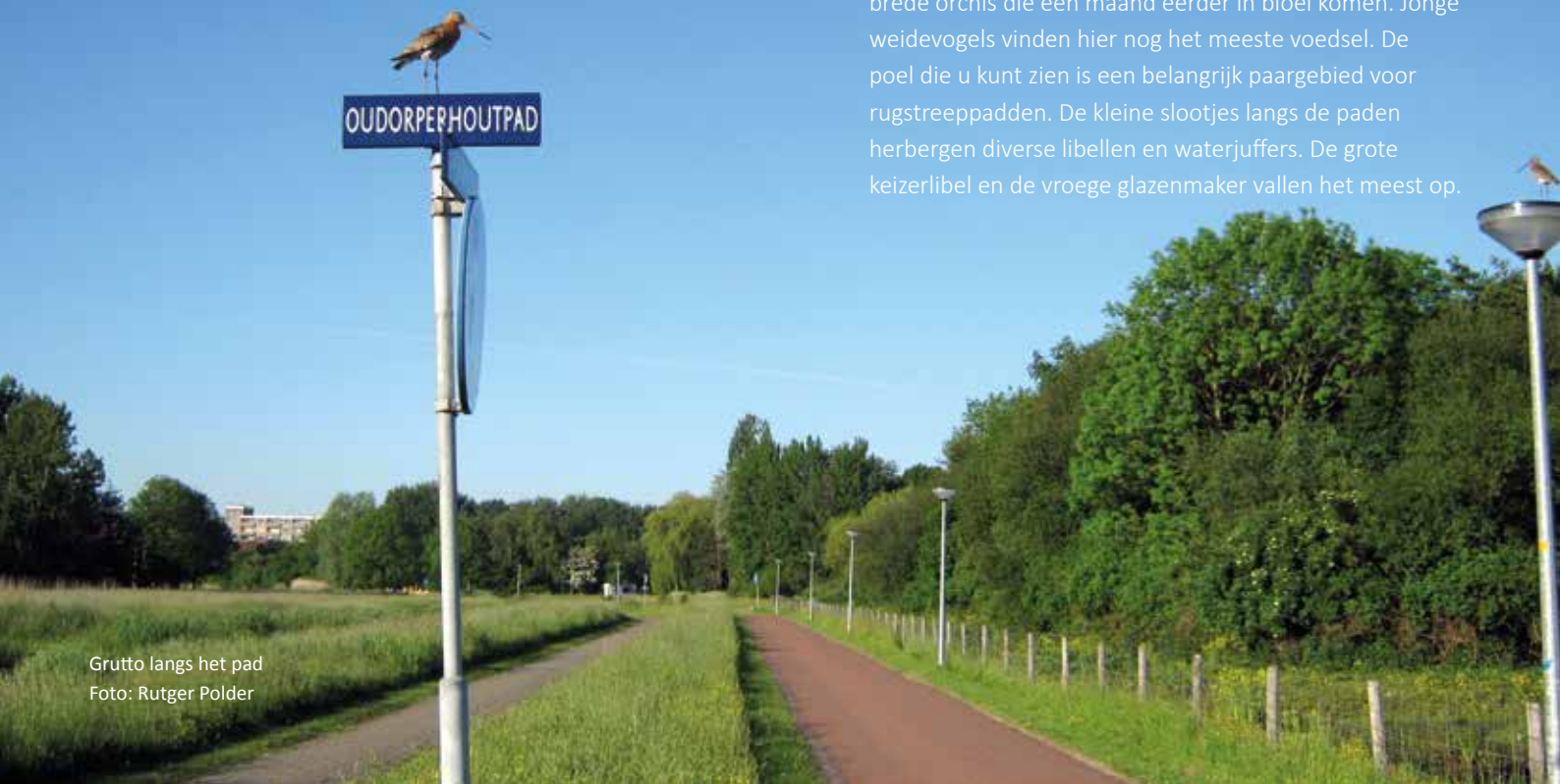
Grutto langs het pad

Sinds 2016 heeft ook de ijsvogel in de Oudorperhout een territorium. De luide roep is vaker te horen dan de vogel zichtbaar is. Het weiland aan de rechterkant van de brede sloot is enige jaren geleden afgeplagd en al snel verschenen hier de eerste orchideeën. Nu worden er minimaal twee soorten gevonden. De meest voorkomende is de rietorchis, maar er staan ook veel brede orchis die een maand eerder in bloei komen. Jonge weidevogels vinden hier nog het meeste voedsel. De poel die u kunt zien is een belangrijk paargebied voor rugstreeppadden. De kleine slootjes langs de paden herbergen diverse libellen en waterjuffers. De grote keizerlibel en de vroege glazenmaker vallen het meest op.